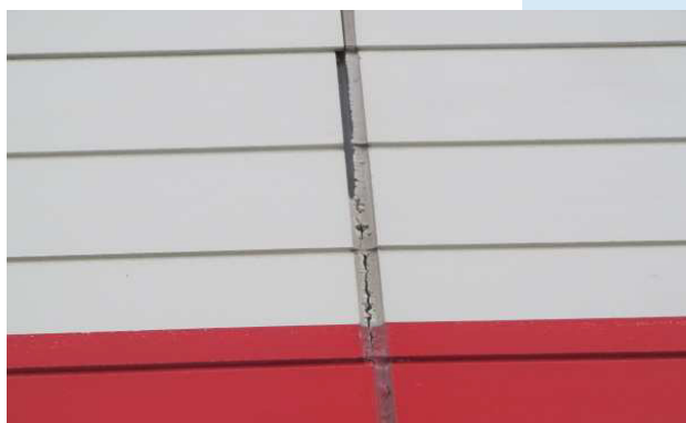
⑥ シーリング材の劣化